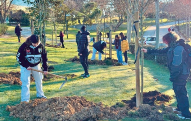
Los alumnos de los institutos José Luis Garcí y Aldebarán, participando en las plantaciones del programa ‘Un árbol por tu futuro’.