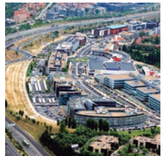
Alcobendas, entre las ciudades más inteligentes del mundo