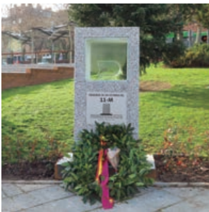
Inaugurado el Memorial de las Víctimas del 11M