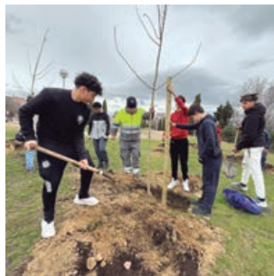
Más de 3.000 nuevos árboles plantados en los dos últimos años