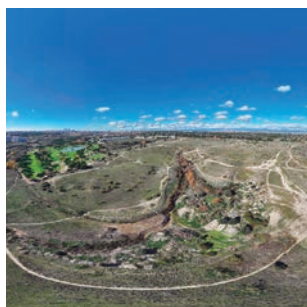
Nuevas oportunidades de vivienda limítrofes con Alcobendas