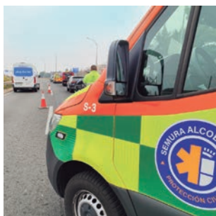
El Semura cumple seis meses con 1.120 avisos atendidos