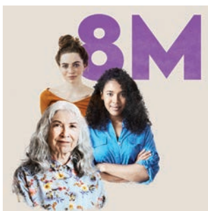
‘8M Día de la Mujer: Todas Las Edades, Todas Las Voces’