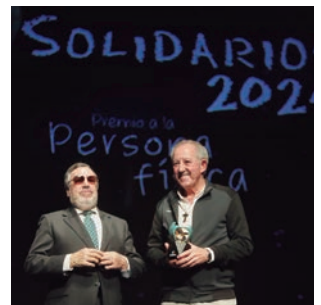
La ONCE entrega en Alcobendas sus premios solidarios