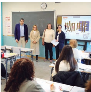
Primera promoción de la Escuela Oficial de Idiomas de Alcobendas