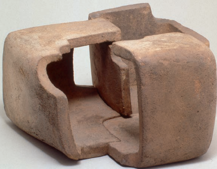
Eduardo Chillida. La casa del poeta III. 1981. Tierra chamota. Chillida Leku.