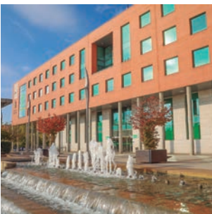
Alcobendas comienza 2025 con nuevas rebajas de impuestos