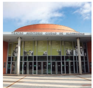
El Teatro Auditorio inaugura una nueva temporada