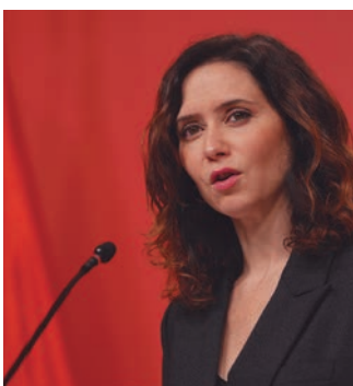
La presidenta regional, presentó las rebajas de impuestos que la Comunidad de Madrid aplicará en 2025.

También la Comunidad de Madrid estrena 2025 con nueve rebajas de impuestos enfocadas para facilitar la compra y el alquiler de viviendas, que suponen un ahorro de 170 millones de