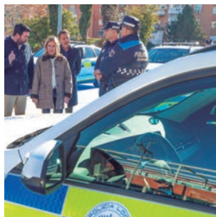
Nuevos vehículos de la Policía Local más seguros y sostenibles