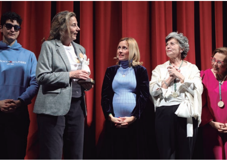
La Fundación Sin daño recibió el 'Premio de la Paz a los Valores Humanos' que otorga la Hermandad de Nuestra Señora de la Paz.