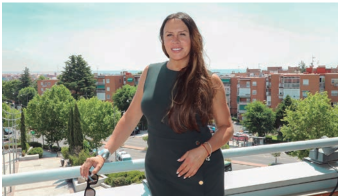
Karla Sofía Gascón, durante su visita al Ayuntamiento tras ganar el premio a ‘Mejor Actriz’ en el Festival de Cannes en el año 2024.

Aunque Penélope no consiguió el premio en esa edición, lo lograría en 2009 como Mejor Actriz de reparto gracias a la película Vicky Cristina Barcelona , dirigida por Woody Allen, iniciando su discurso de agradecimiento con un