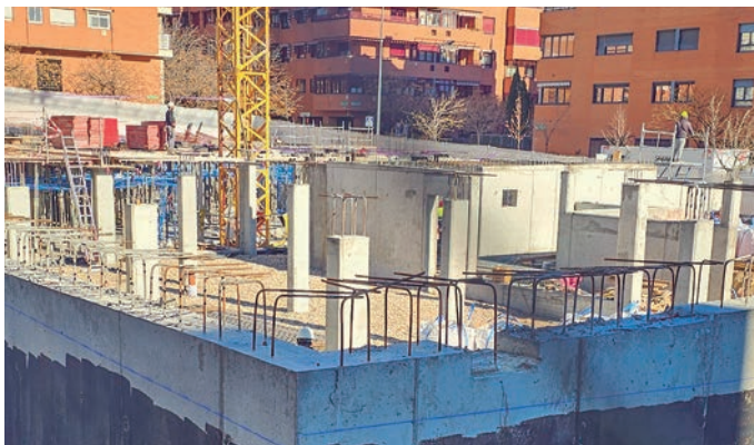
Obras de los 36 alojamientos dotacionales que se construyen en la calle Dr. Ángel Olivares.

equipo de gobierno para incluir a Alcobendas en el Plan VIVE Solución Joven de la Comunidad de Madrid. Las dos administraciones estaban de acuerdo en la necesidad de esta inclusión.