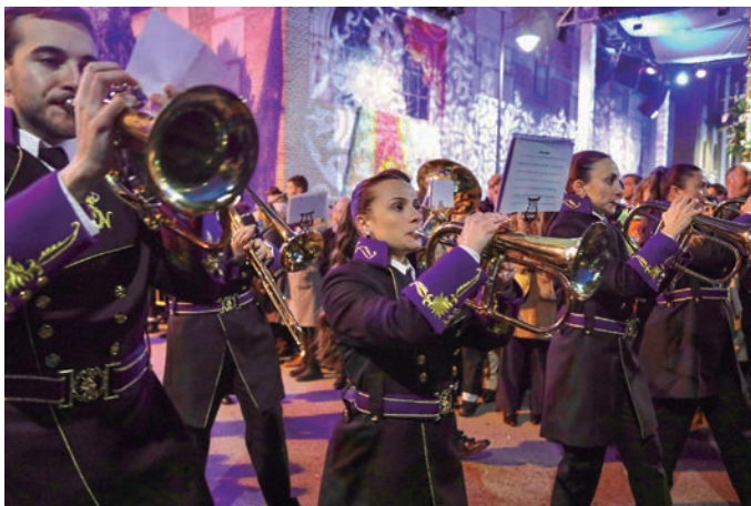
Las bandas Municipal de Alcobendas; Pasión y Muerte, de Ajalvir; y Padre Jesús Nazareno El Bonillo, de Albacete, acompañaron a la Virgen en la procesión.

inaugurada Fotografía Antigua ; o asistir a conciertos y a los distintos trofeos deportivos.