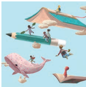
Del 19 al 21 de abril, celebramos nuestra 'IV Feria del Libro'