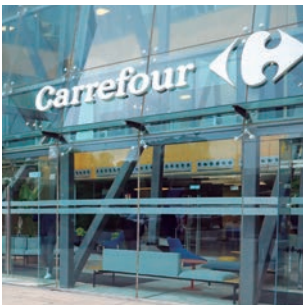
Carrefour estrena sede central en nuestra ciudad