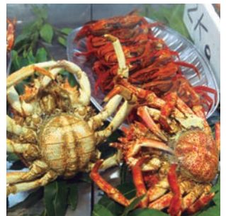
Los mejores productos gallegos, en la 'XXVII Feria del Marisco'