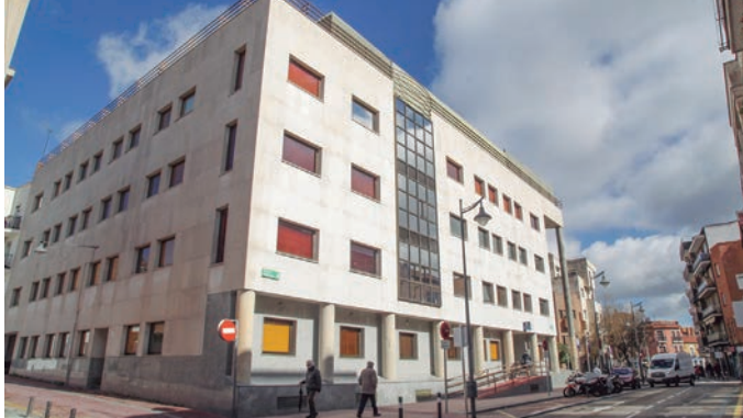
Edificio de los Servicios Sociales en la calle Libertad.

apoyo. Para ello, nacen tres proyectos nuevos: Taller de familias acogedoras (para ayudarlas a crear vínculos fuertes), Crecer en familia (un espacio grupal para compartir experiencias y reflexionar sobre la crianza y la convivencia familiar) y Kairós (enfocado a jóvenes con quienes se lleva trabajando años en el servicio y que tiene como objetivo la reflexión, el acompañamiento y el fomento del desarrollo personal, de las habilidades sociales y de la autoestima).