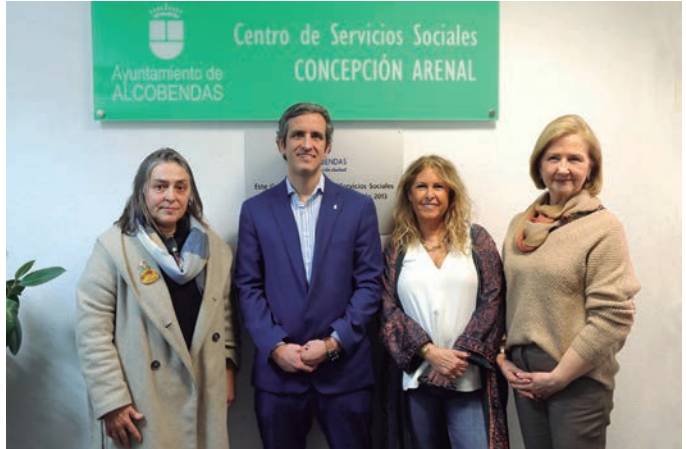
El alcalde, las concejalas de Protección Social y Bienestar Social y la presidenta del Patronato Concepción Arenal, durante el acto de nombramiento del centro.

“La labor desarrollada por los servicios sociales municipales de Alcobendas ha sido y es fundamental. Solo el pasado año fueron atendidas más de 8.000 personas. El Ayuntamiento de Alcobendas destinó casi dos millones a ayudas de necesidades básicas y más de 300.000 euros para ayuda la infancia”, decía la conce-