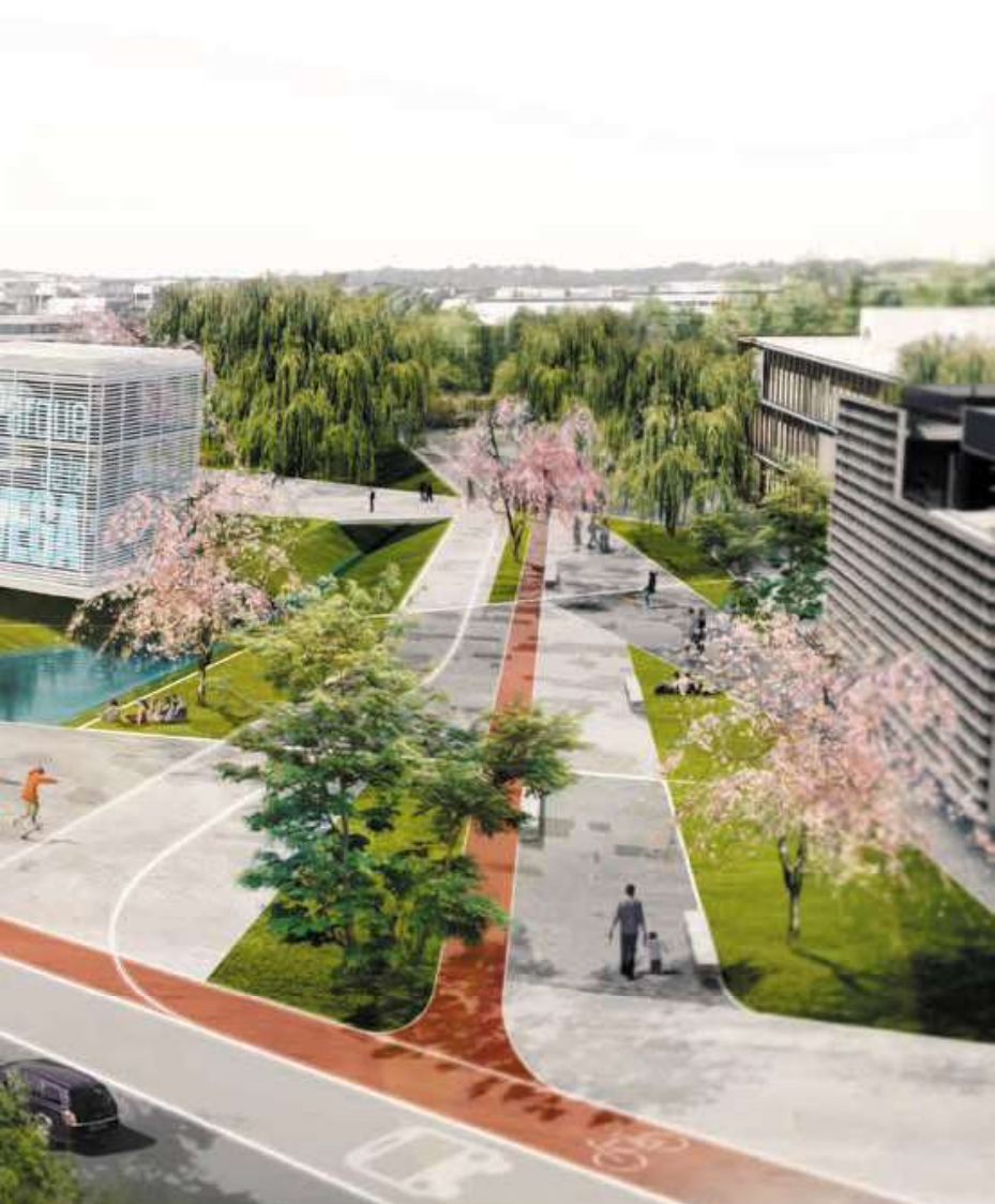
Puerta 4.0 Estado Actual