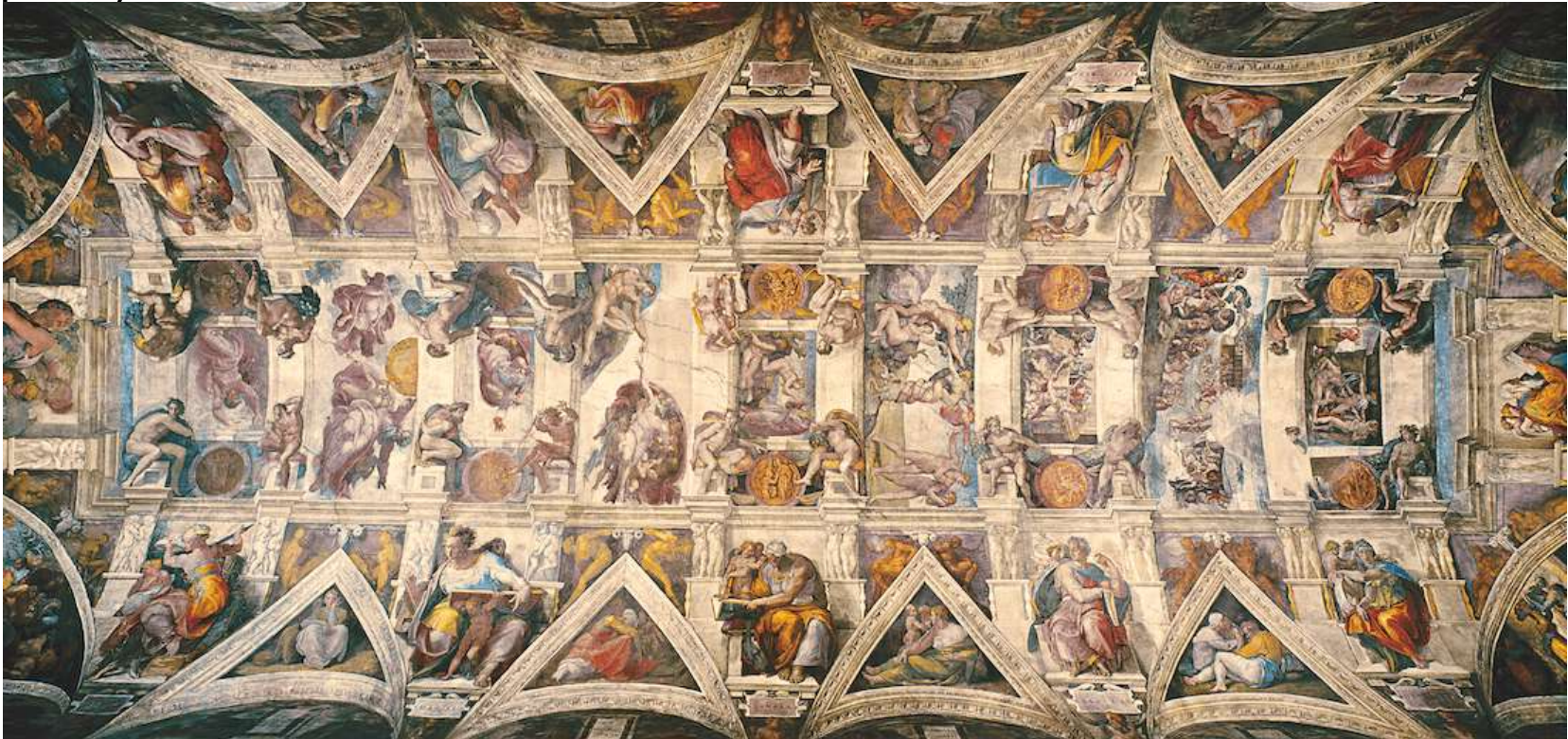
Bóveda de la Capilla Sixtina – Ciudad del Vaticano

La creación de Adán: es un fresco en la bóveda de la Capilla Sixtina , pintado por Miguel Ángel alrededor del año 1511 . Ilustra uno de los nueve episodios del Génesis , en el cual Dios le da vida a Adán , el primer hombre . Es el cuarto de los paneles que representan episodios del Génesis en el techo de la capilla, fue de los últimos en ser completados. Es de las obras de arte más apreciadas y reconocidas en el mundo. (cita e imagen de wikipedia).