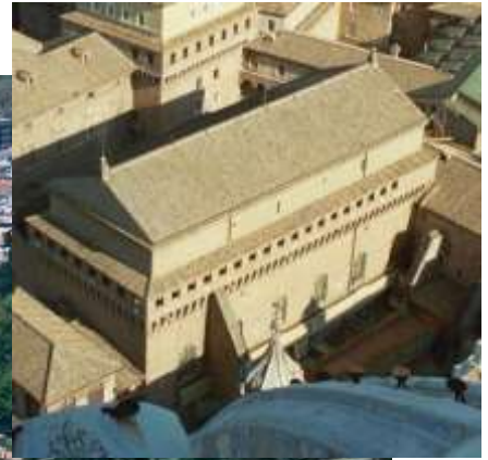
La Basílica de San Pedro, señalada a la derecha se encuentra la Capilla Sixtina