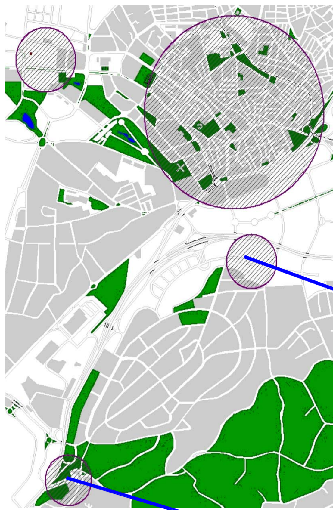
PLAZA DE LA MORALEJA